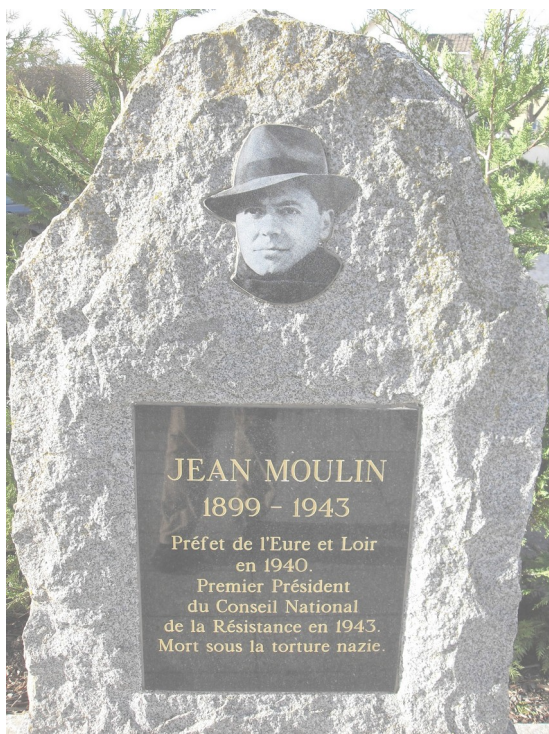
Jean Moulin était un résistant